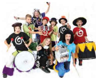
Die Samba Kids sorgen für Stimmung

15 Uhr Wir lassen die Luftballons steigen!